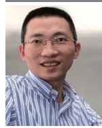
CHEN Yidan 텐센트(Tencent)의 핵심 설립자 테크놀로지사 매출 기준 중국 내 1위