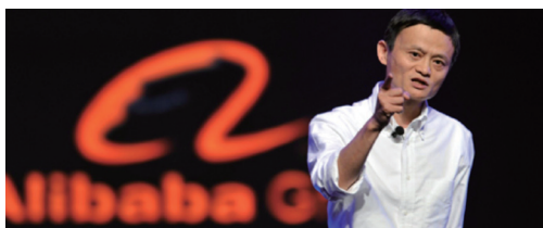
마윈(Jack Ma, 알리바바그룹 설립자 겸 회장) : 세계 최대 전자상거래 회사

최고 수준의 비즈니스 리더들을 불러 모으는 것은 비즈니스 스텝에 있어 쉬운 일이 아니다. 그런 점에서 CKGSB EMBA는 흥편을 찾다고 표현할 수 있다.