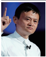
Jack MA 알리바바그룹 (Alibaba Group)의 설립자 겸 회장 세계 최대 전자상거래 회사