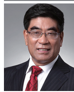
FU Chengyu 시노펙(SINOPEC)의 회장 겸 대표 매출 기준 중국 내 1위 세계 5위 기업