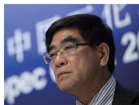
푸 청위(FU Chengyu, 시노펙 회장 겸 대표) : 매출 기준 중국 내 1위, 세계 5위 그룹

최고 수준의 비즈니스 리더들을 불러 모으는 것은 비즈니스 스텝에 있어 쉬운 일이 아니다. 그런 점에서 CKGSB EMBA는 흥편을 찾다고 표현할 수 있다.