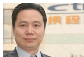
판 민(FAN Min, 씨트립 공동설립자) : 중국 최대 온라인 여행사

CKGSB EMBA는 시장 및 정치 환경 관련 글로벌 리소스를 활용하는 지혜를 제공함으로써, 새로운 차원의 비즈니스 교육을 선보이고 있다.