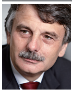
Ralf SPETH 재규어(Jaguar), 랜드로버(Land Rover)의 CEO 영국 최대의 자동차 제조사