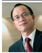
GUO Guangchang 포선그룹(Fosun Group)의 회장 중국 최대의 민간 대기업