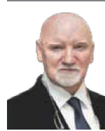
Tom HUNTER 헌터재단 이사 독자활동가, 투자자, 스코틀랜드 최초 억만장자