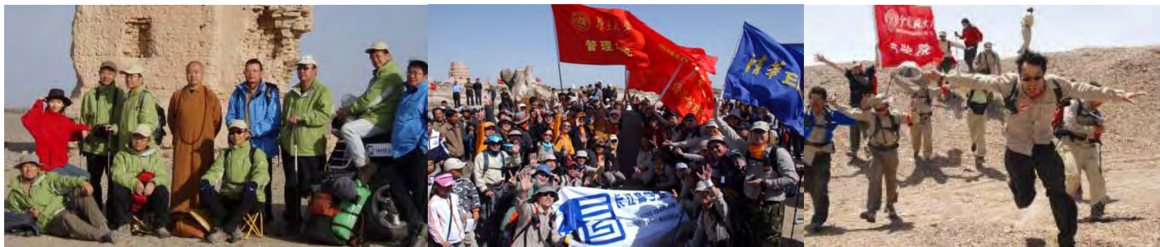
2007年5月，第二届商学院戈壁徒步挑战赛